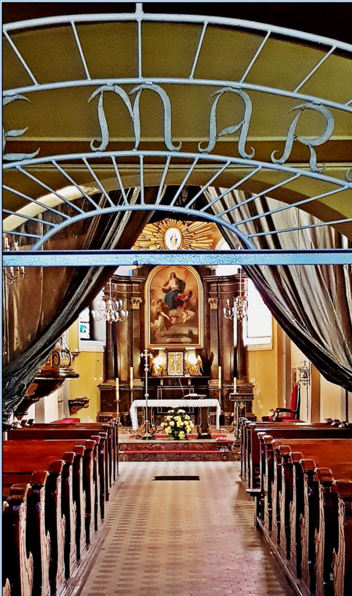
Remont 24.11.2019 r.