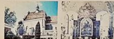
Zbrostławice – Lubie 11 km Zbrostławice – Toszek 22 km Zbrostławice – Zgorzelec 397 km Zbrostławice – Santiago de Compostela 3589 km

Po cudownych wydarzeniach, kiedy to parafianie przechodząc obok kaplicy słyszeli płacz Madonny, w 1827 roku figurka Madonny z Dzieciątkiem została umieszczona w kościele w nastawie bocznego ołtarza. W 1944 roku figurkę ustawiono w ołtarzu głównym, gdzie do dzisiaj jest otaczana przez okolniczną ludność szczególnym kultem.