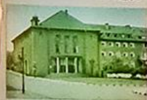
SZPITALEM ŚW. KAMILA.