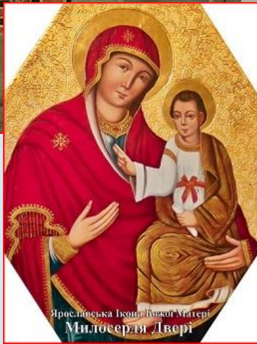
Ярославська Ікона Божої Матері Милосердя Двері