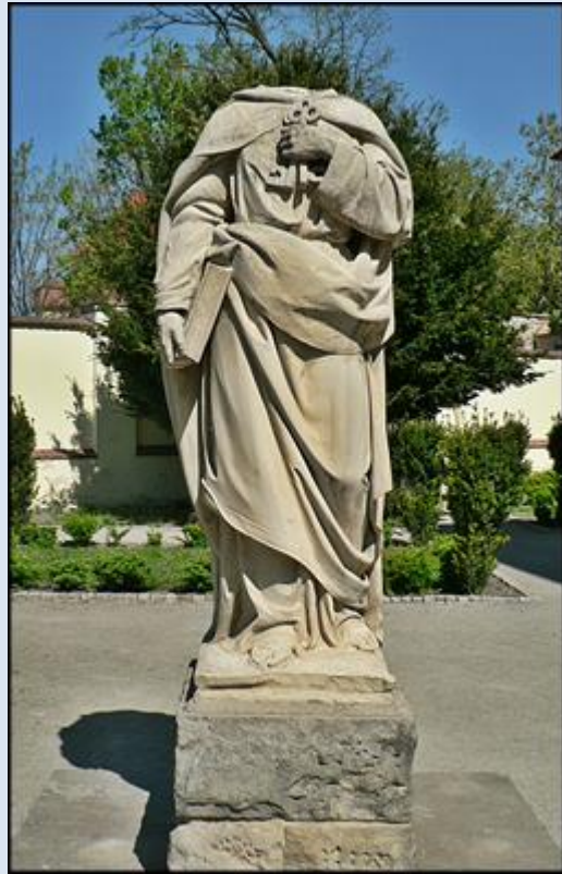
W 2013 r. św. Piotr z głową; w 2019 – bez głowy