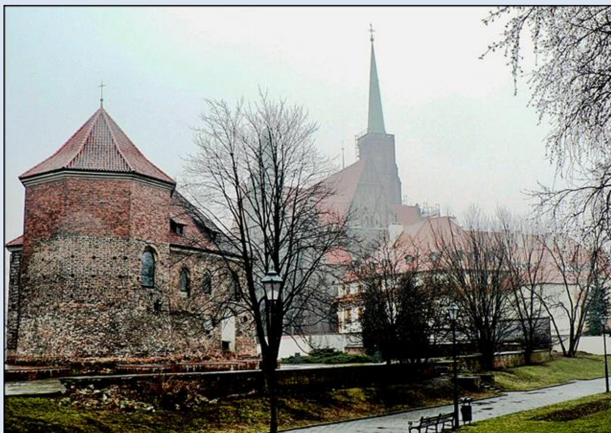
zdjęcia: Jan Nitecki

zdjęcia w czerwonej obwódce zapożyczono z: https://polska-org.pl/foto/53/Kosciol_sw_Marcina_ul_Marcina_sw_Wroclaw_53949.jpg