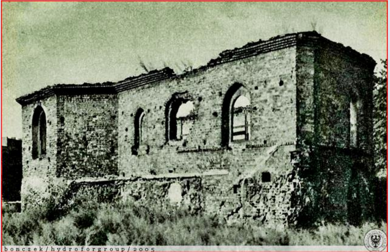
boncsek / hydroforgroup / 2005