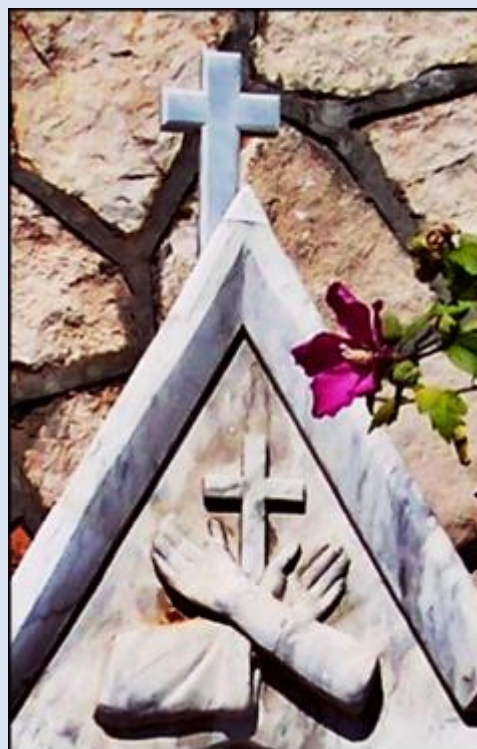
Koło Domu Ulgi w Cierpieniu zaczynają się stacje Drogi Krzyżowej