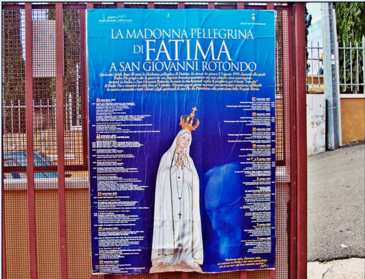
i plakat z MB Fatimską