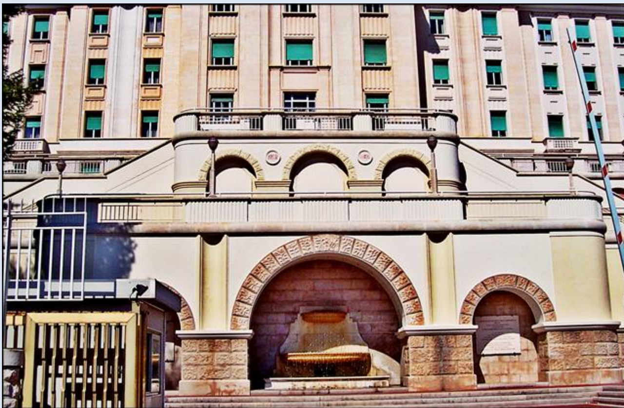
Koło Domu Ulgi w Cierpieniu zaczynają się stacje Drogi Krzyżowej