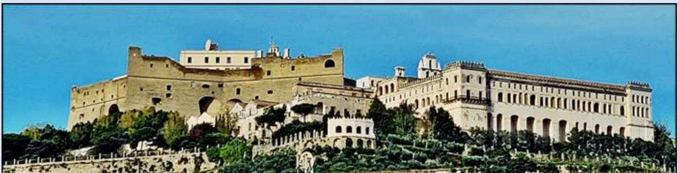
i z dołu na zamek i klasztor