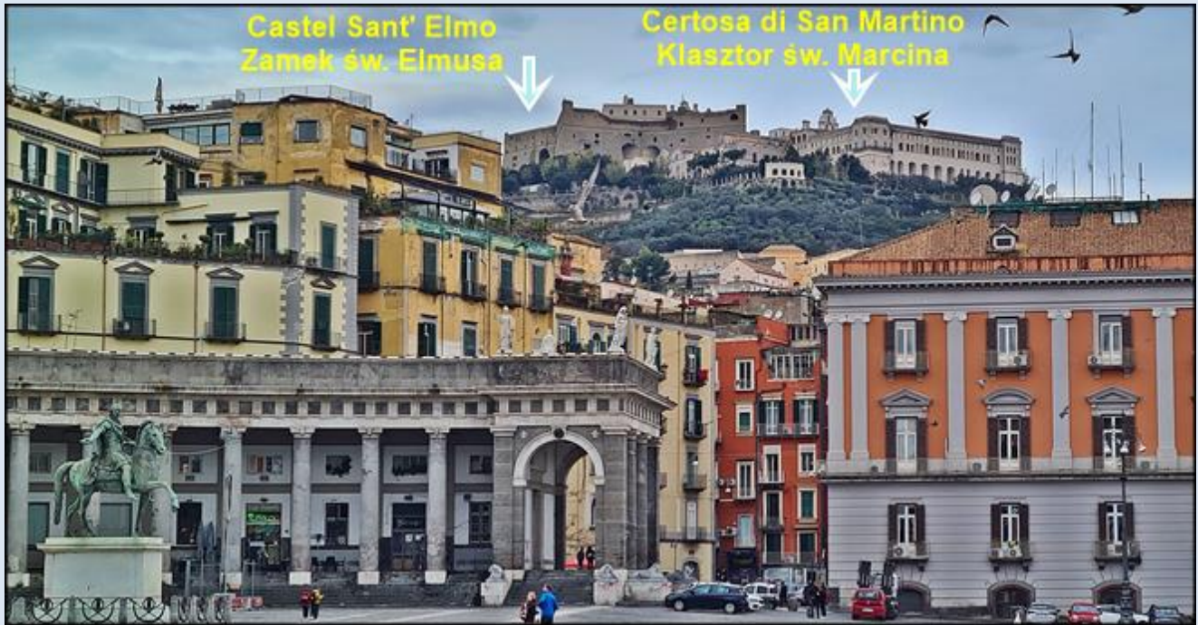
Widok na wzgórze Vomero z Placu Plebiscytowego (Piazza del Plebiscito) z lewej: Kolumnada Bazyliki Królewskiej pw. św. Franciszka di Paola