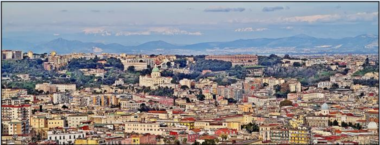
widok na Neapol z wysokości zamku