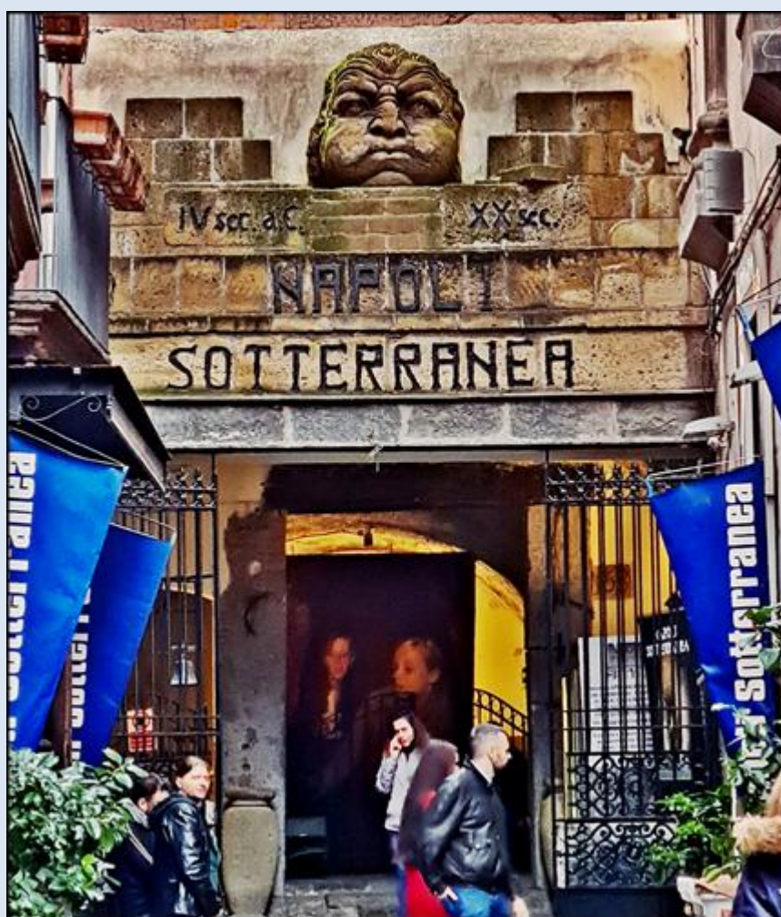
jedno z wejść do podziemnego Neapolu