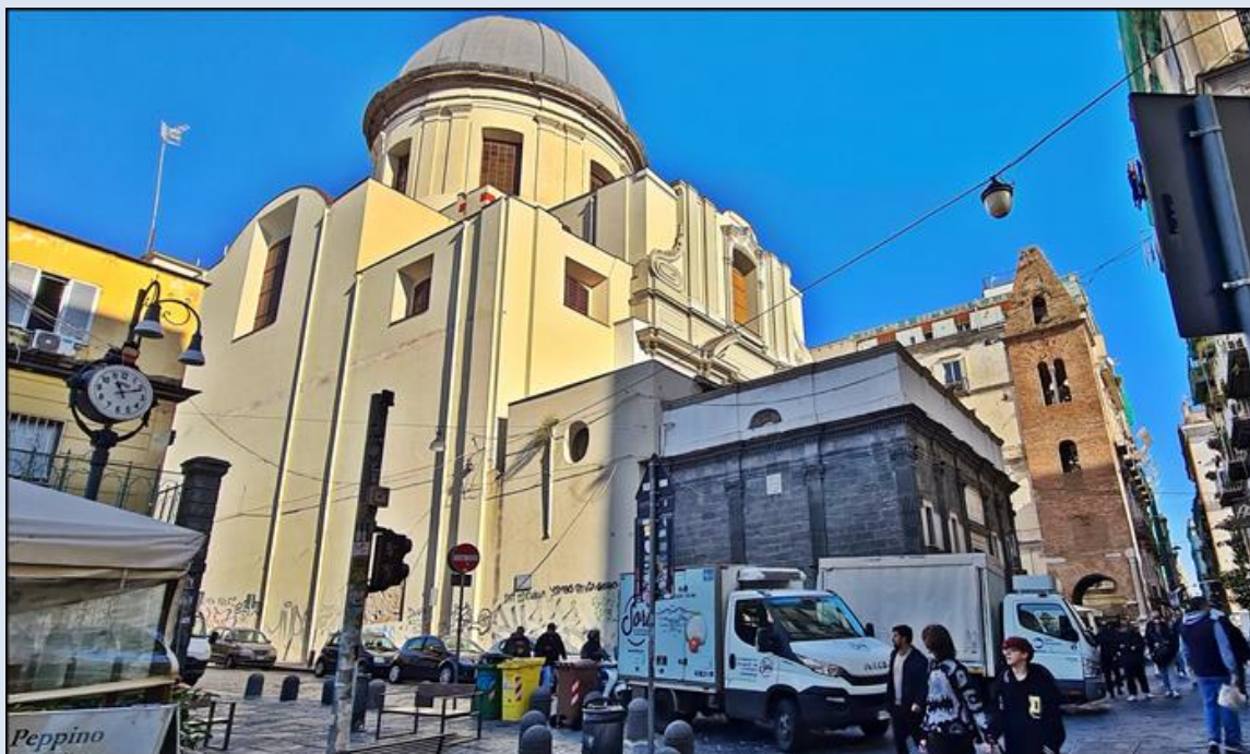
Bazylika z innej perspektywy – po prawej: dzwonnica