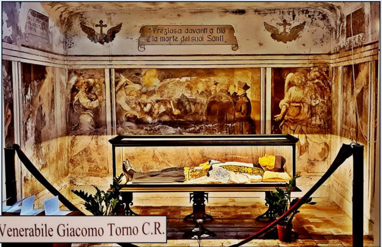
Venerabile Giacomo Torno C.R.