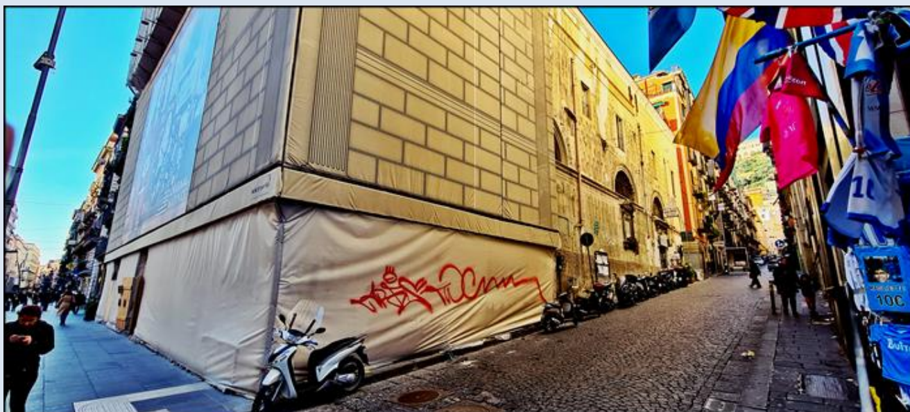
widok z zewnątrz w czasie renowacji 28.11.2022 r.