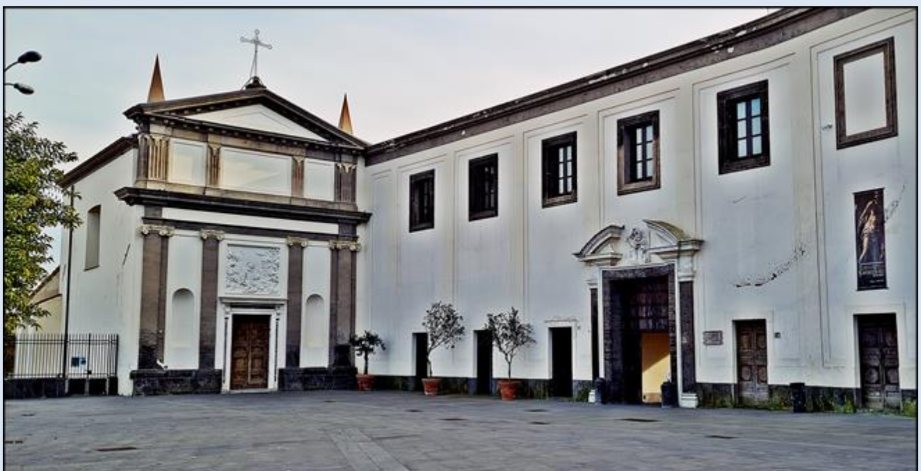
z lewej – Kościół ogólnodostępny, z prawej – wejście na tereny Klasztoru św. Marcina (Muzeum)

Chiesa delle donne a San Martino sulla collina del Vomero