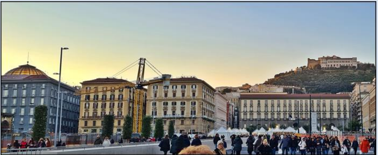
widok za wzgórze Vomero z lewej: kopuła Galerii Umberto I