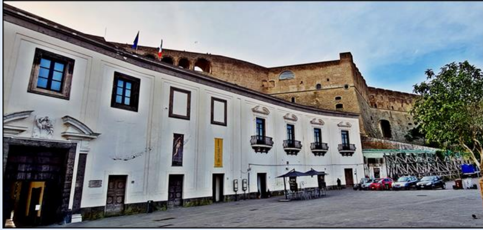
wejście na tereny klasztorne