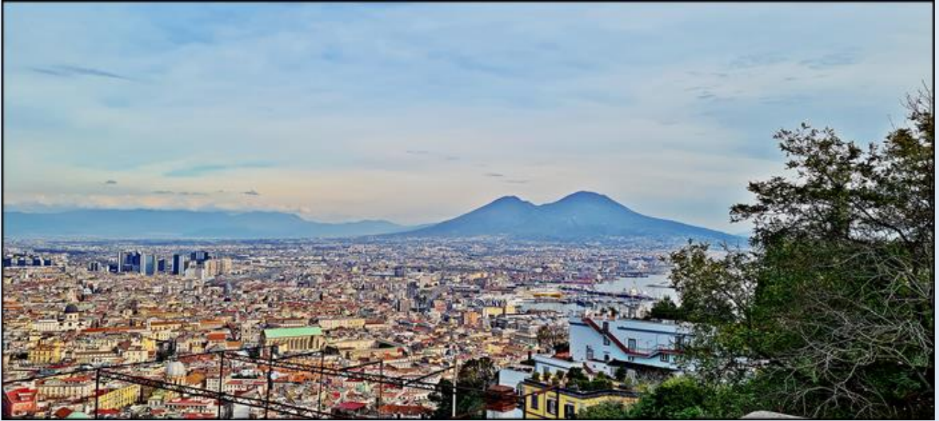
widok ze wzgórza Vomero na Neapol i Wezuwiusz