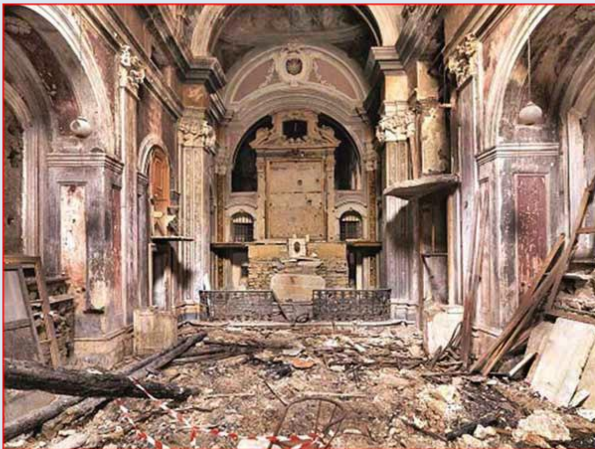
po trzęsieniu ziemi w roku 1980