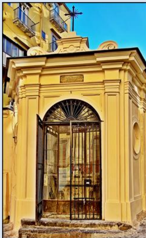
kapliczka po lewej stronie kościoła (już po odmalowaniu)