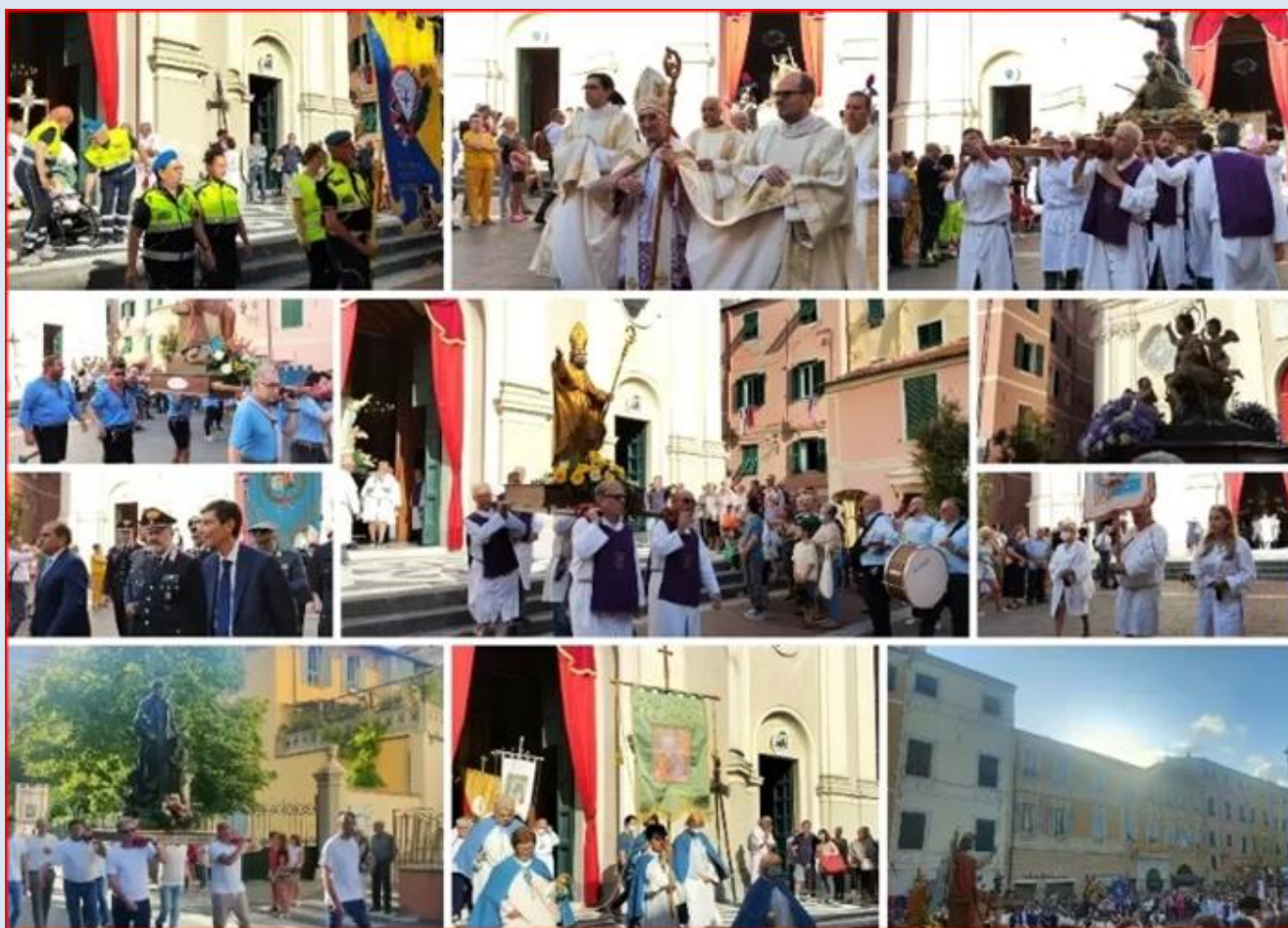
Procesja w Uroczystość patronalną św. Jana Chrzciciela

Bazylika Kolegiacka San Giovanni Battista jest głównym miejscem kultu katolickiego w Oneglia, jednej z dwóch głównych dzielnic miasta Imperia; wznosi się w centrum historycznego miasta, które zawsze było centrum miejskiego życia. Apsyda skierowana jest na wschód. Kościół został erygowany jako bazylika mniejsza 24 czerwca 2017 roku w dniu święta patronalnego San Giovanni Battista.