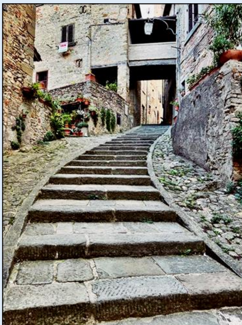
słynne schody w Anghiari

MY ZAŚ POWINNIŚMY SIĘ CHLUBIĆ KRZYŻEM PANA NASZEGO JEZUSA CHRYSZTUSA