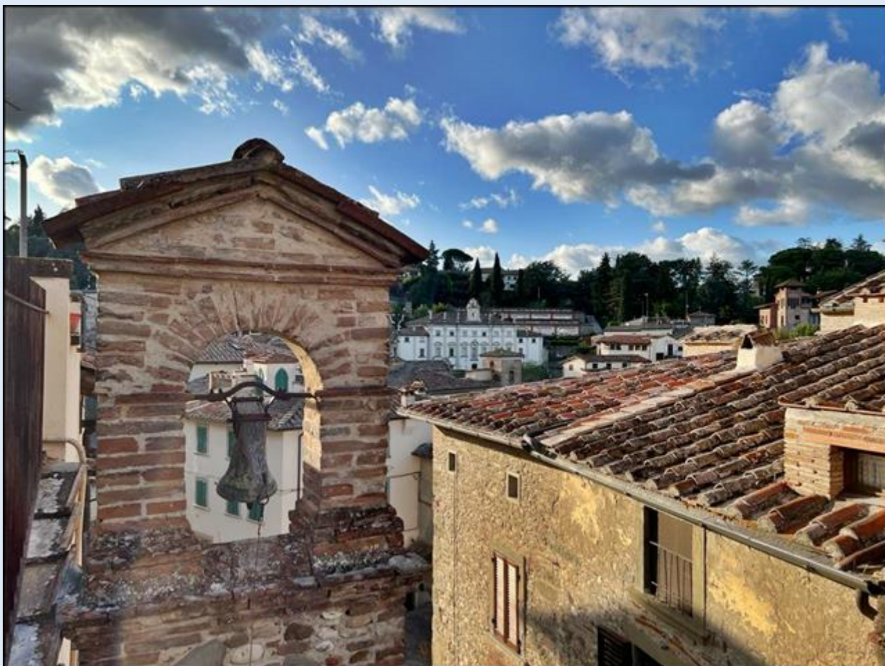
widok z Opactwa św. Bartłomieja na dzwonnice (?)