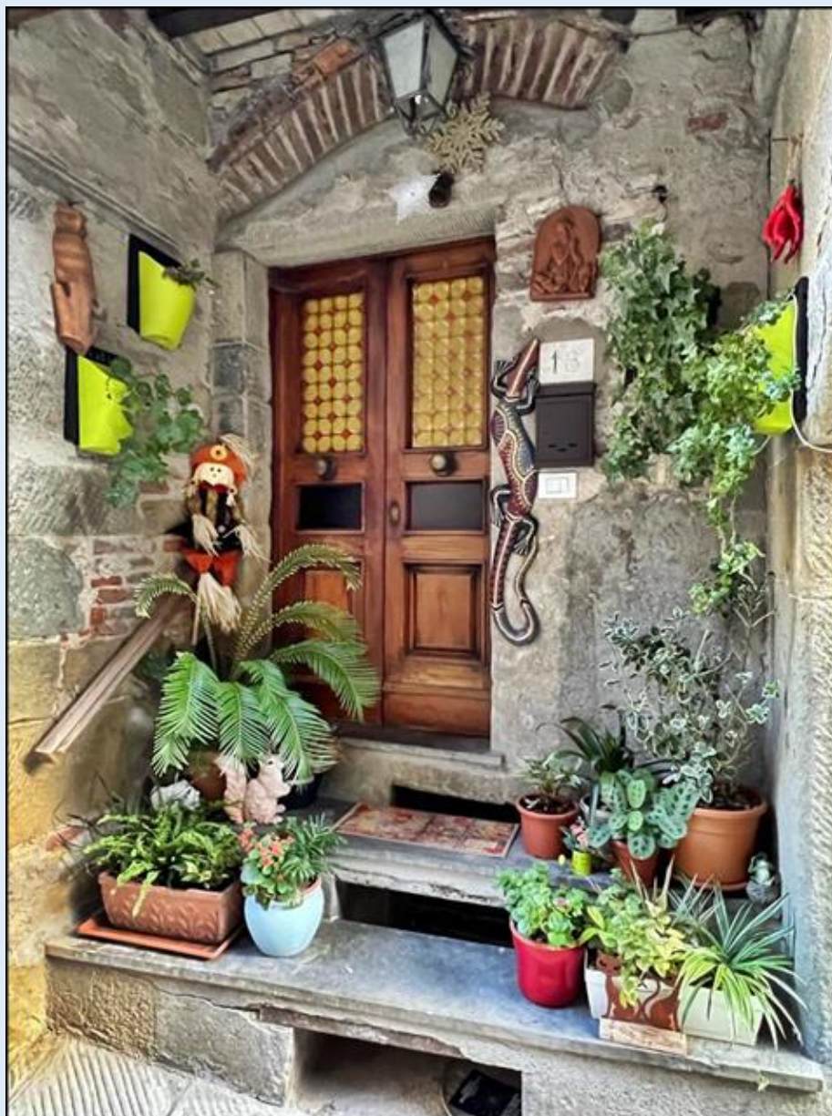
wejście do jednego z domów w Anghiari