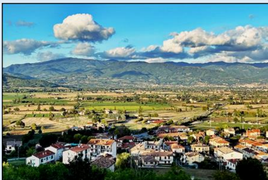
widok na Anghiari z Opactwa św. Bartłomieja