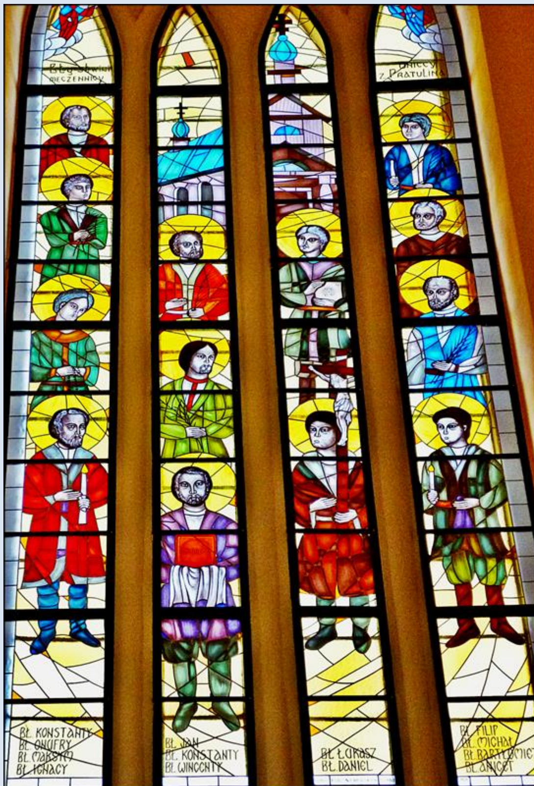
Sokołów Podlaski, MAZ, wt w kt Niepokalanego Serca NMP

zobacz: Święci w Polsce i ich kult w świetle historii http://sancti-in-polonia.wietrzykowski.net/2w.html http://sancti-in-polonia.wietrzykowski.net/7w.html