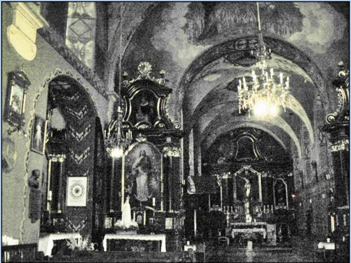
W ołtarzu bocznym znajduje się obraz św. Antoniego, obok wota. Sanktuarium Matki Bożej Łaskawej.