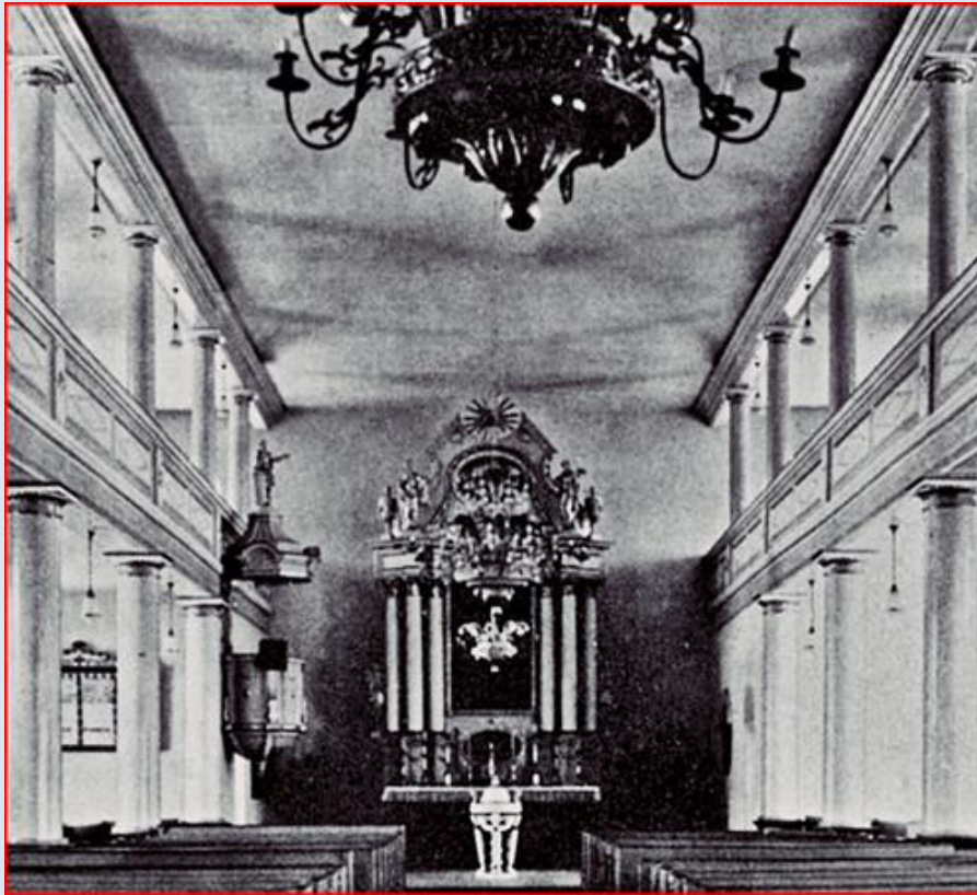
zdjęcia historyczne z lat 20-30 dwudziestego wieku