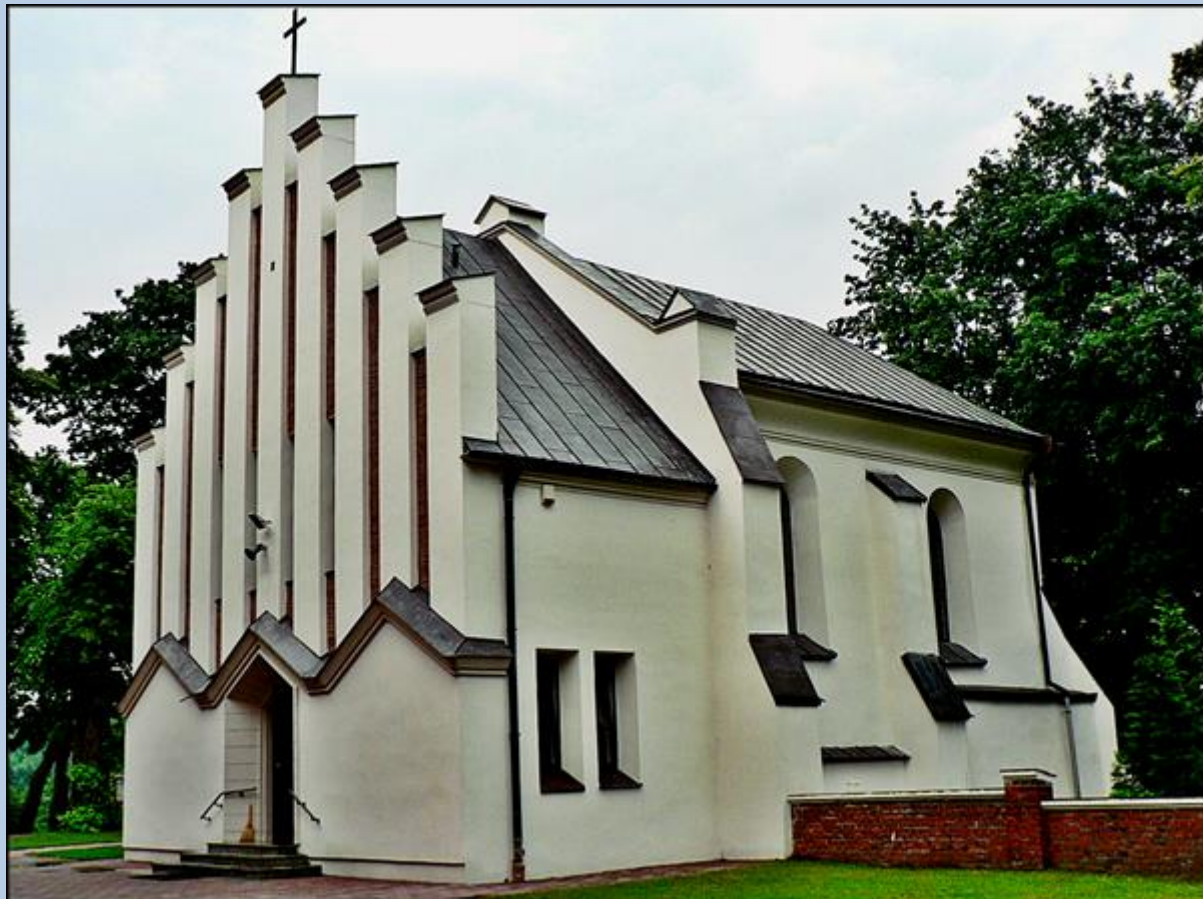
Kaplica Sanktuarium MB Kębelskiej