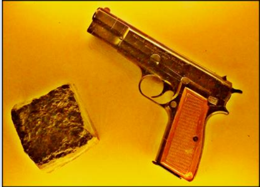
pistolet, którym Ali Agca strzelał do Jana Pawła II (wypożyczony przez Muzeum)