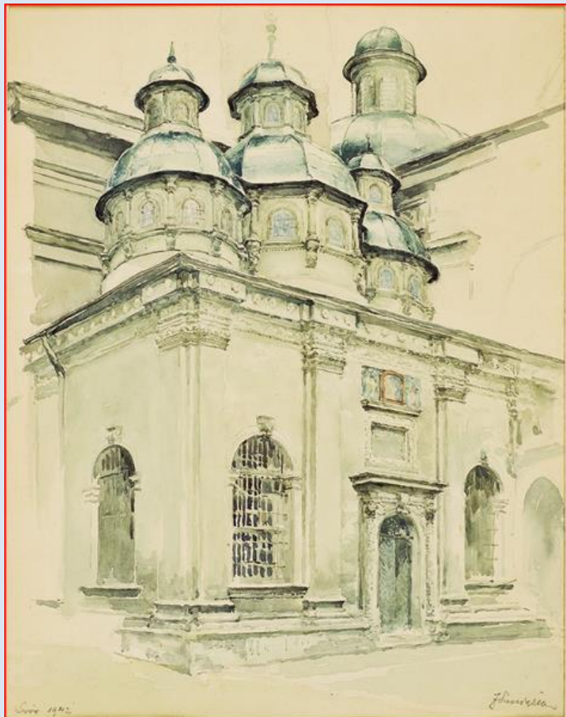
Kaplica Trzech Świętych Hierarchów