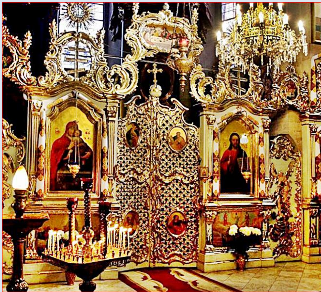
Ikonostas w Cerkwi Uspińskiej (Zaśnięcia NMP)