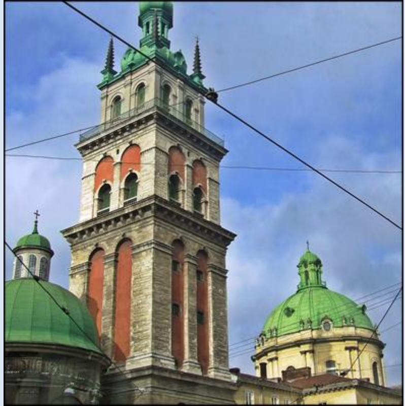
Dzwonnica = Wieża Konrniakta i jedna z trzech kopuł Kaplicy Trzech Hierarchów (z lewej) oraz kopuła Cerkwi Uspieńskiej (z prawej)