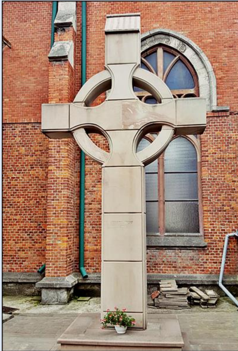
Krzyż - Pamiątka Misji Parafialnych 2013