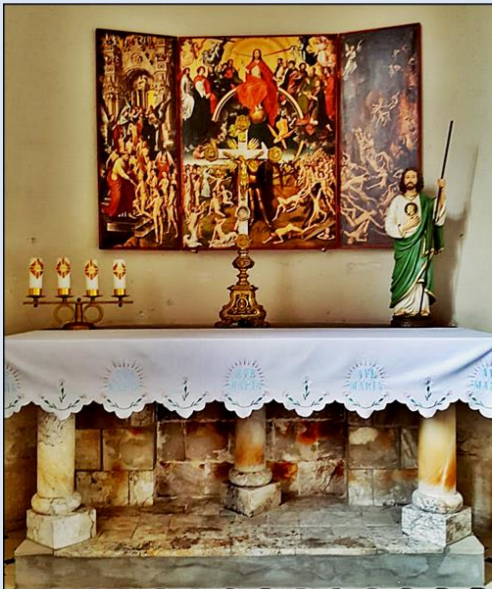
Wnęka lewej nawy. Św. Juda Tadeusz.