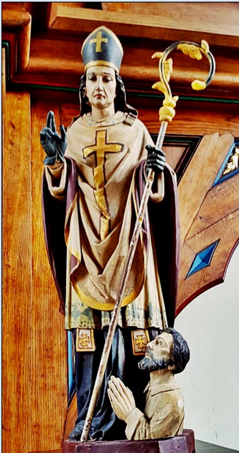
Figurka św. Stanisława w ołtarzu głównym