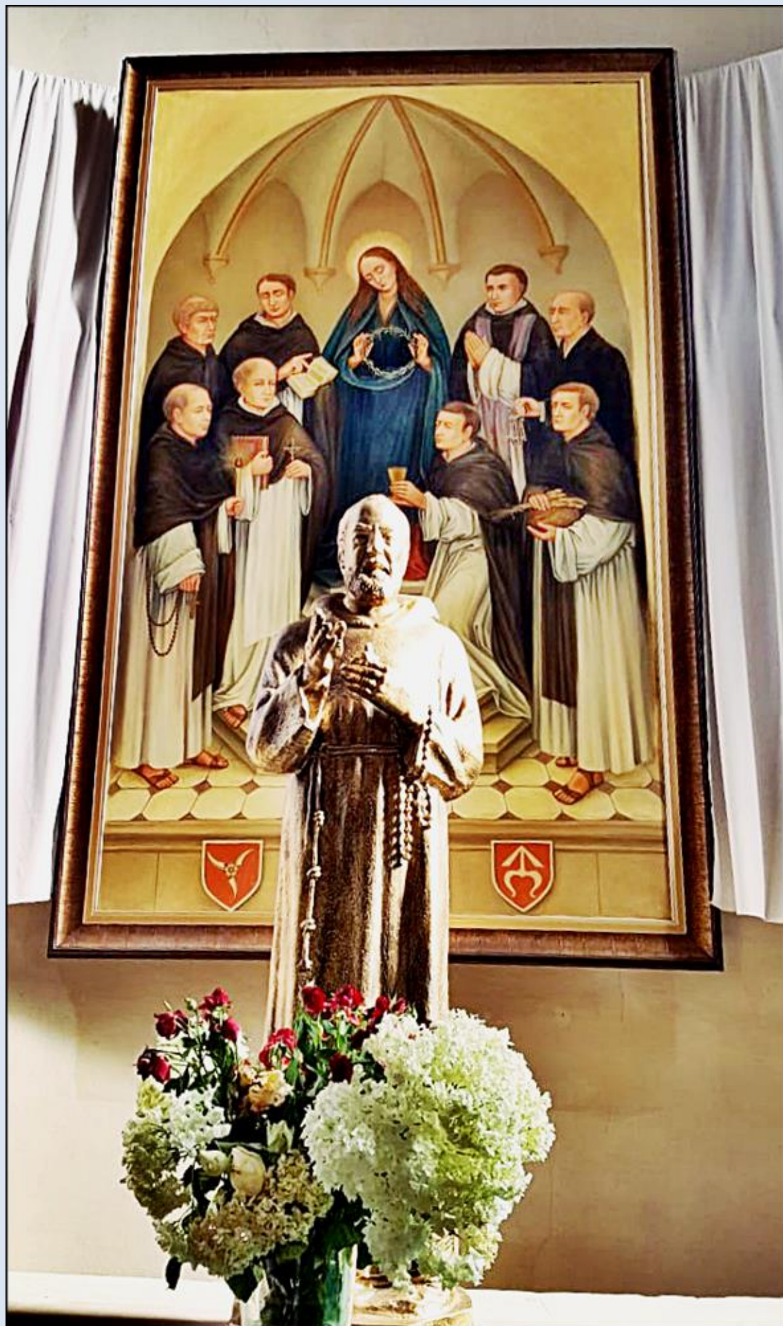
Figura o. Pio w lewej kaplicy (1.08.2023)