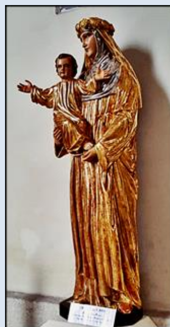
MB Fatimska - Obraz Patrona Kościoła św. Stanisława Bpa i Męczennika - św. Róża z Limy