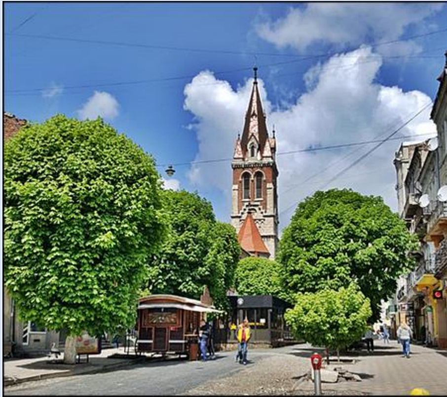
Widok od strony południowej