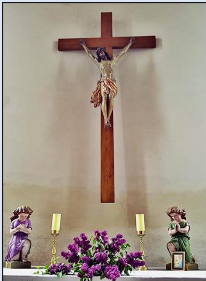
Boczna kapliczka Ukrzyżowanego