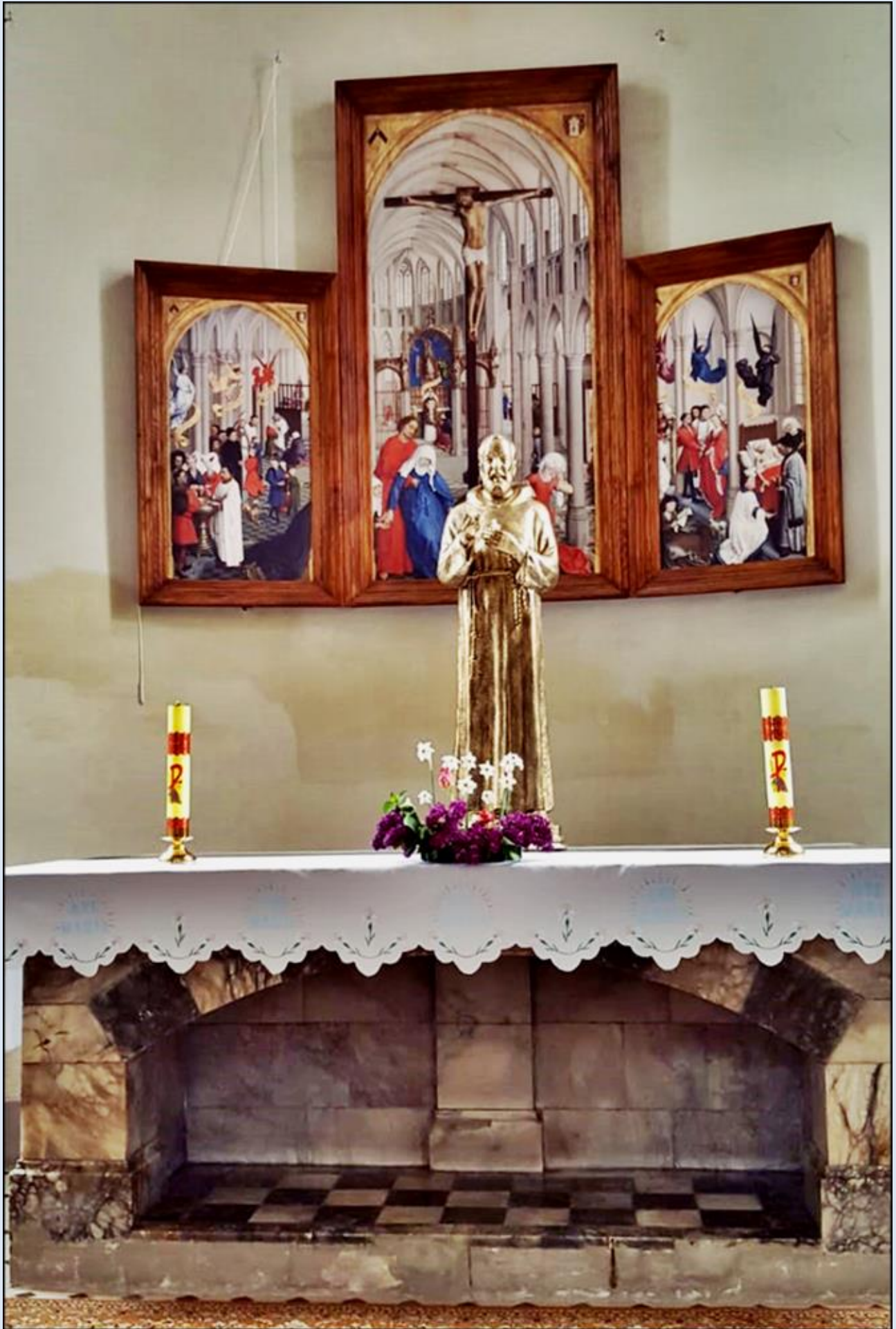
Kaplica Wiary-Nadziei-Miłości. Statua św. O. Pio