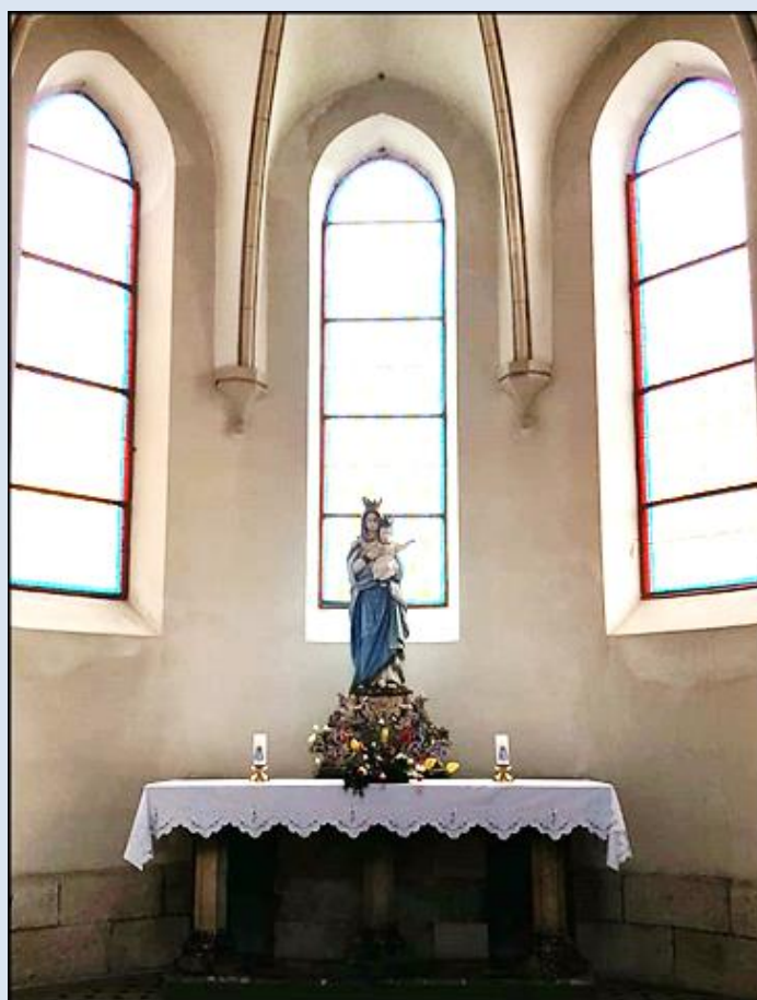
Kapliczka z figurą MBożej