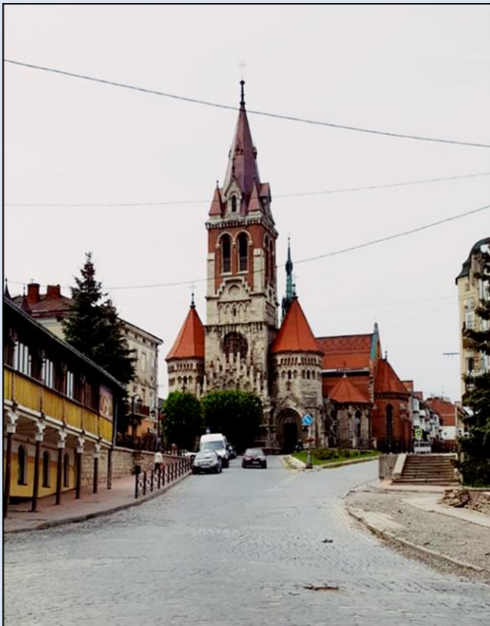
Widok kościoła od doliny Seretu