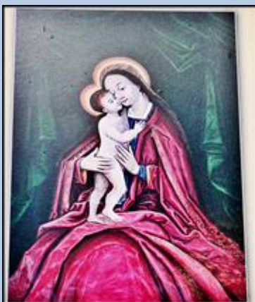
Matka Boska Tylicka - Madonna z Dzieciątkiem niderlandzkiego malarza Adriana Ysenbrandta