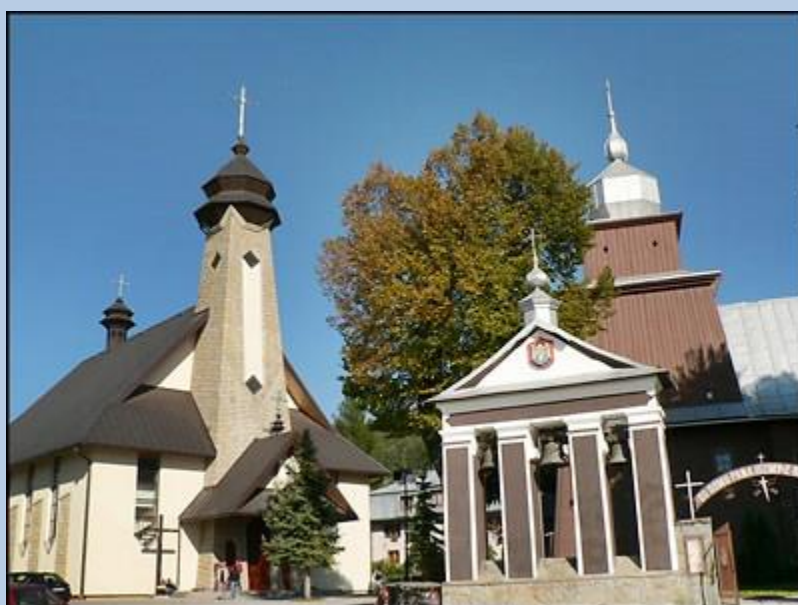
z lewej: Kościół pw. Imienia Maryi; z prawej – śś. Apostołów Piotra i Pawła