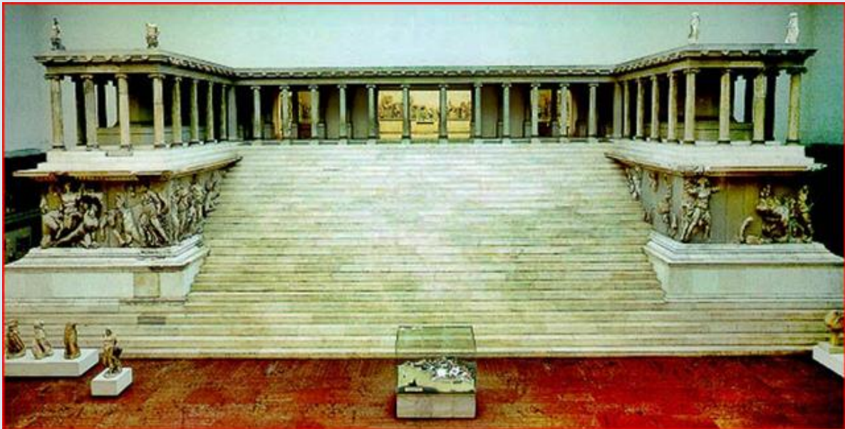
Ołtarz pergamoński obecnie w Muzeum w Berlinie