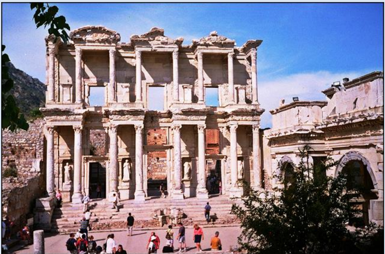
Ruiny starożytnej świątyni Artemidy Efeskiej, gdzie nauczał św. Paweł (Dz 19, 23-41)