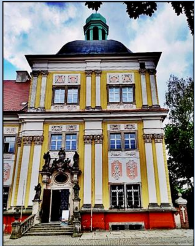
wejście do Bazyliki i wejście do klasztoru