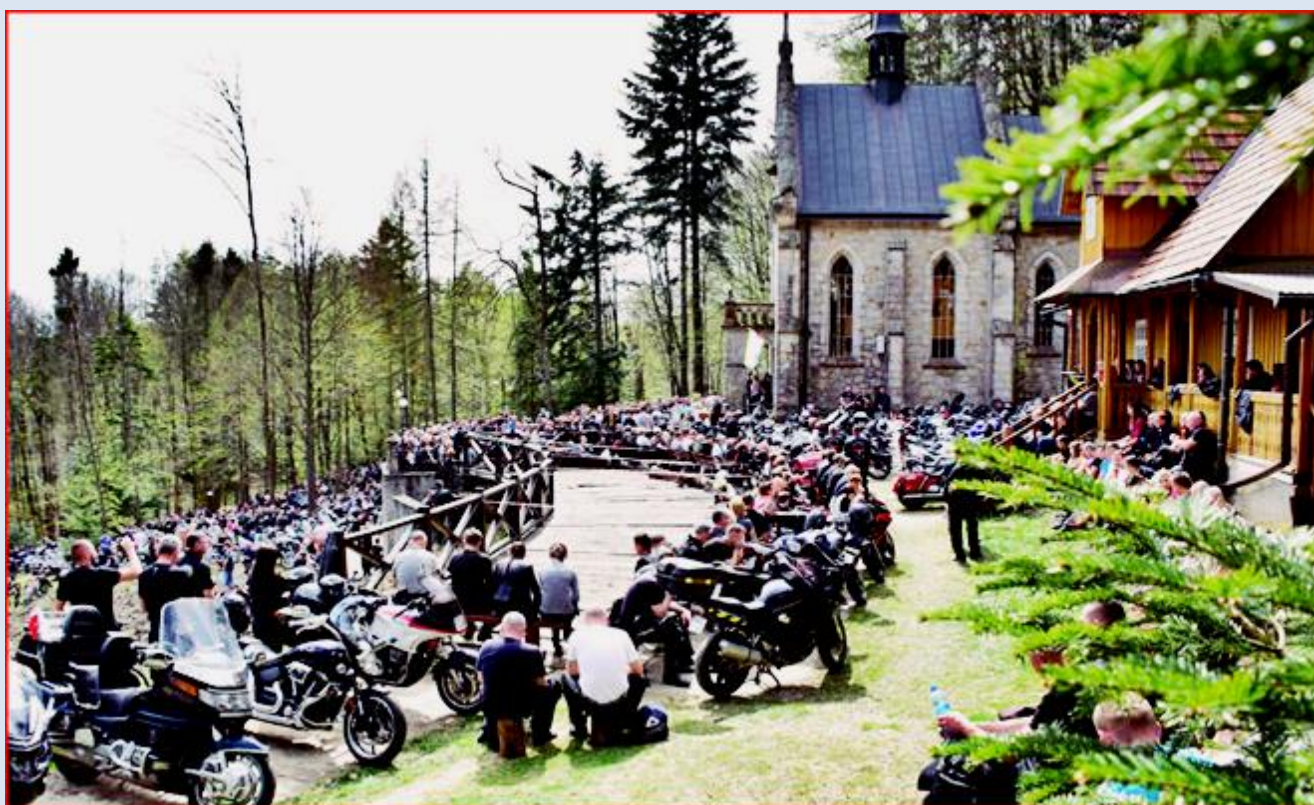
i współczesne pielgrzymki motocyklistów