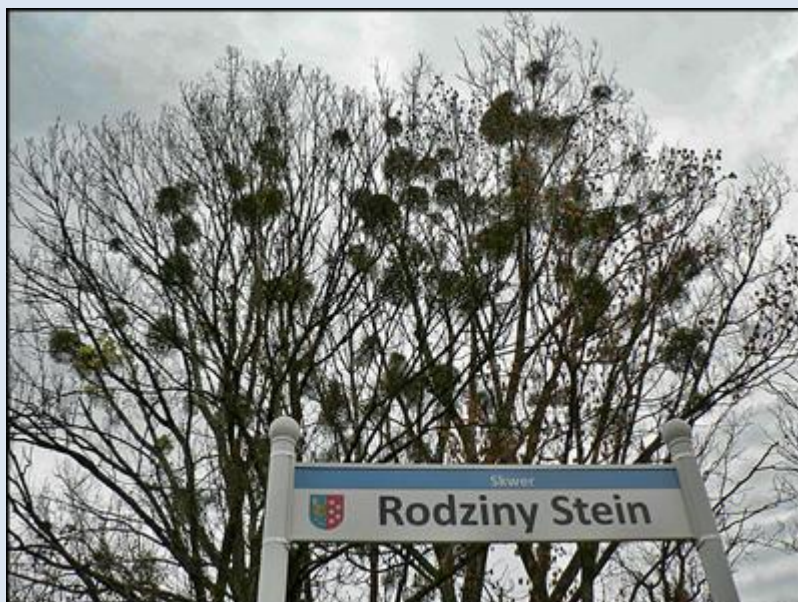
8. Lubliniec, ŚLS, Skwer Rodziny Stein