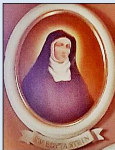
9. Lubliniec, ŚLS, wt w ko Podwyższenia Krzyża Św.