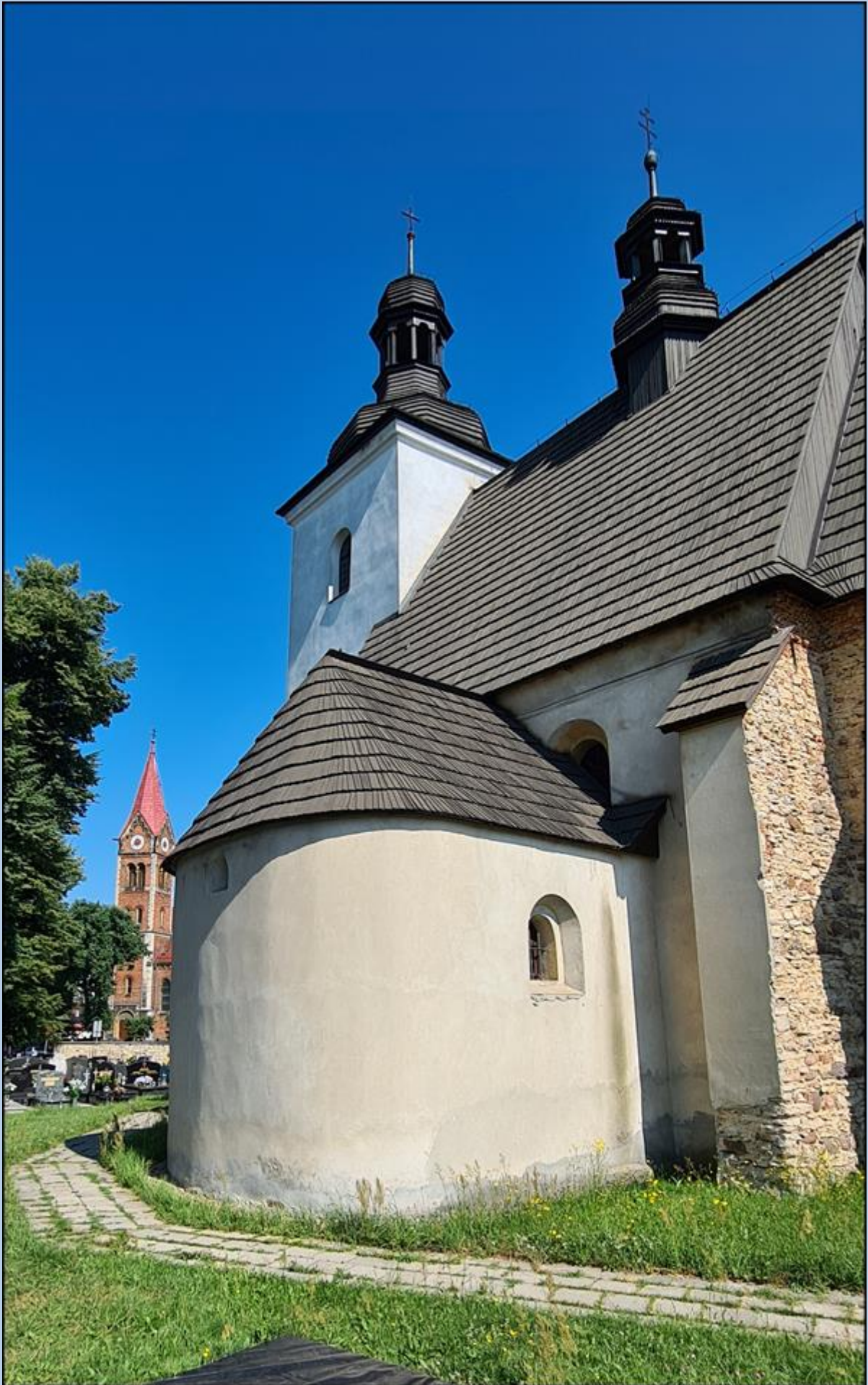
stary Kościół św. Marcina, a w tle, za drogą, nowy Kościół św. Marcina