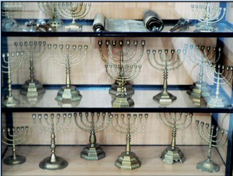
Świeczniki Chanukowe - 8 i 9 ramienne świeczniki zapalane podczas święta Chanuka.