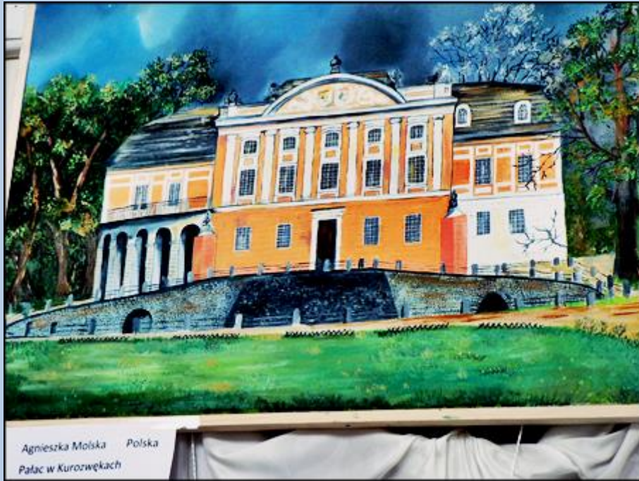
Agnieszka Mojska Polska Pałac w Kurozwękach