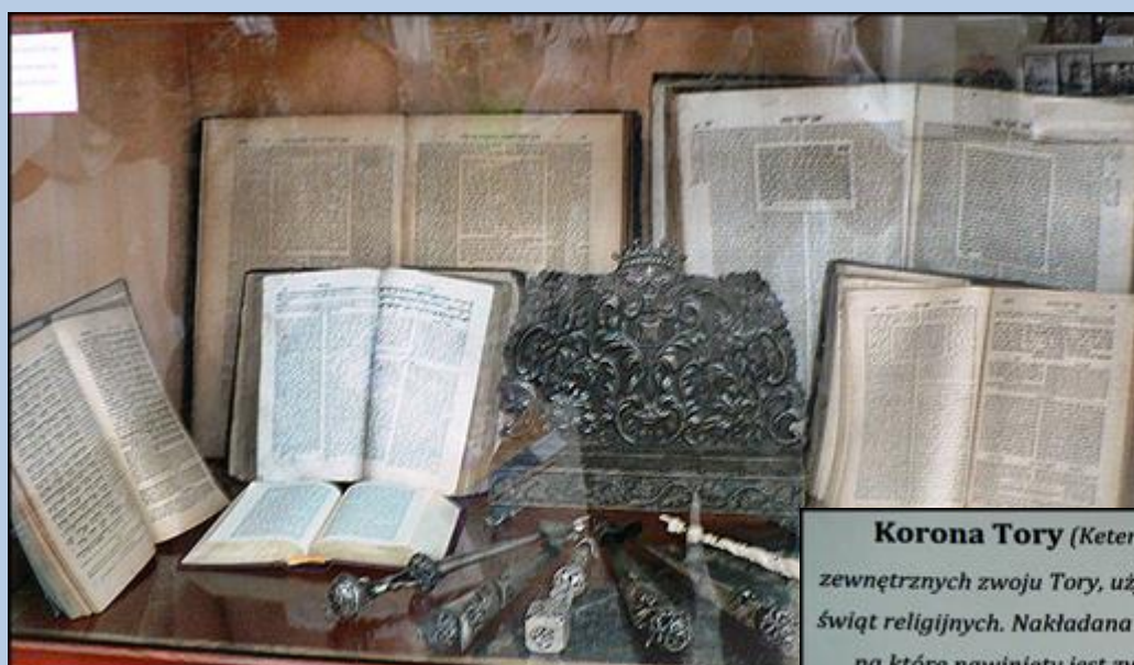
Korona Tory (Keter Tora) - to jedna z ozdób zewnętrznych zwoju Tory, używana podczas największych świąt religijnych. Nakładana jest na dwa drewniane wałki, na które nawinięty jest zwój z tekstem Tory. Korona symbolizuje Boga, zwieńczenie życia pobożnego wyznawcy oraz jest symbolem uznania najwyższej władzy, świętości mądrości Tory.