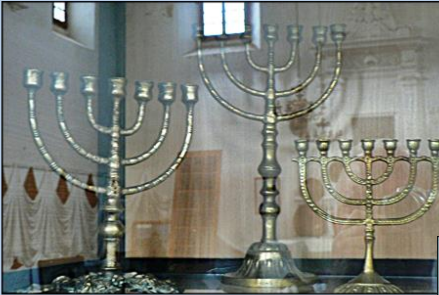
Menora - siedmioramienny świecznik, symbolizuje on krzew gorejący, który zobaczył Mojżesz na górze Synaj.