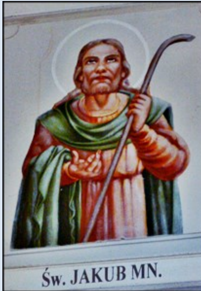
Św. JAKUB MN.