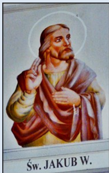
Św. JAKUB W.