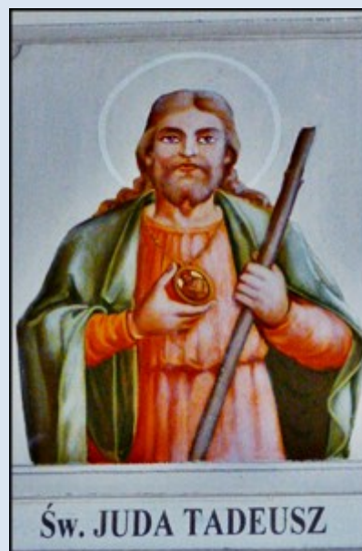
Św. JUDA TADEUSZ