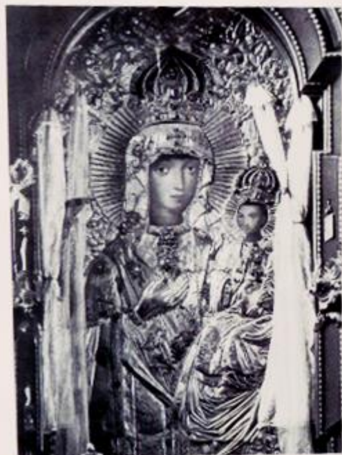
Supraslska ikona Matki Bożej, fragment, fot. Petrov, 1964 fot. G. W. Zupnik, W. Nowak, W. Szefer-Tomaszka, P. Szefer-Tomaszka w: J. Kowalewski, 2001, s. 11, 111, 114, 201

W spisie inwentarzowym pochodzącym z drugiej połowy XVIII wieku pojawia się skrajnie odnotowana informacja o koronach wierzających głowy Chrystusa oraz Marii: „[...] Obraz Świętej Dziewicy przykrywa rzyta mieściami złoczoną, wylonaną w zupruburskim warsztocie. Korona na obrazie złożona ręcznej roboty wysadzana 23 różnokolorowymi kamieniami i 4 perłami. Korona na przedstawieniu Jezusa Chrystusa złoczoną w niej 19 kamieniami”. Zachowane opisy, drzeworyt oraz litografia, datowane na koniec XVIII w., jak również archiwalne zdjęcia ikony Supraslskiej pochodzące z XIX oraz początku XX stulecia potwierdzają fakt ozdobienia koron.