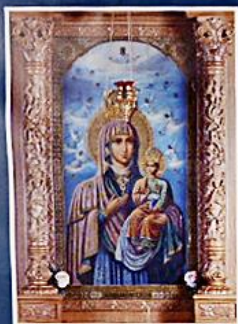
Supraslska ikona Matki Bożej w cerkwi św. Jana Teologa

W XVII stuleciu kult Supraslskiej ikony Matki Bożej przekraczał wymiar lokalny, obejmując swym zasięgiem Grodzieńszczyznę oraz część Podlasia. Półksiężym tego były kopie wizerunku wykonywane dla pobliskich cerkwi i kościołów. Kopie Supraslskiego obrazu znajdowała się m.in. w połobonej w pobliżu Suprasli Kudnicy, jak również w Toplicu, Rudawie czy Tykocinie. Za jedno z powtórzeń Supraslskiej ikony jest uważana również Białostocka ikona Matki Bożej, która powstała najprawdopodobniej z odpisu dużo starszego, pochodzącego z XVII wieku.