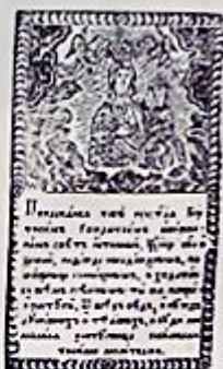
Supraslska ikona Matki Bożej, ok. 1762 fot. G. W. Zupnik, W. Nowak, W. Szefer-Tomaszka, P. Szefer-Tomaszka w: J. Kowalewski, 2001, s. 11, 111, 114, 201

W spisie inwentarzowym pochodzącym z drugiej połowy XVIII wieku pojawia się skrajnie odnotowana informacja o koronach wierzających głowy Chrystusa oraz Marii: „[...] Obraz Świętej Dziewicy przykrywa rzyta mieściami złoczoną, wylonaną w zupruburskim warsztocie. Korona na obrazie złożona ręcznej roboty wysadzana 23 różnokolorowymi kamieniami i 4 perłami. Korona na przedstawieniu Jezusa Chrystusa złoczoną w niej 19 kamieniami”. Zachowane opisy, drzeworyt oraz litografia, datowane na koniec XVIII w., jak również archiwalne zdjęcia ikony Supraslskiej pochodzące z XIX oraz początku XX stulecia potwierdzają fakt ozdobienia koron.