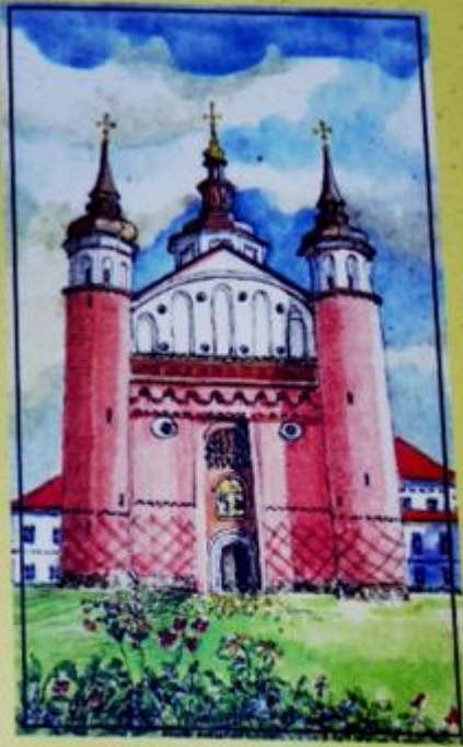
CERKIEW pw. Zwiastowania N.M.P., wybudowana w latach 1503 - 1511, zburzona 23 VII 1944 r. przez oddział niemiecki SS Gallizien, rekonstruowana od roku 1983.