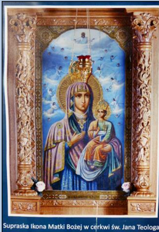
Supraska Ikona Matki Bożej w cerkwi św. Jana Teologa