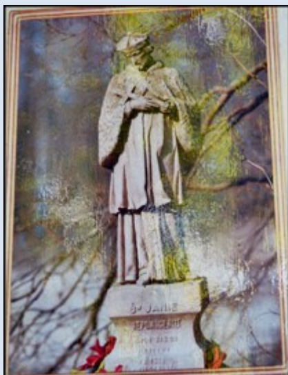
Pomnik Św. Jana Nepomucena