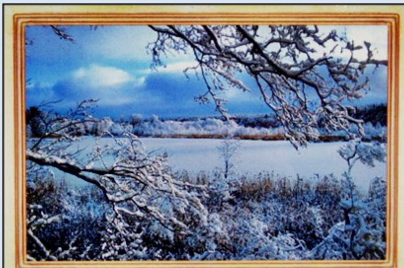
Widok z wieży widokowej