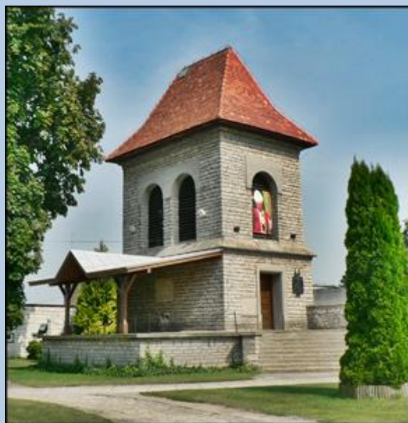
(nr zabytku: A 72 z 1967)