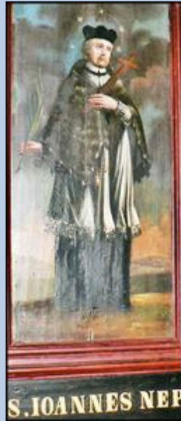
S. IOANNES NEP