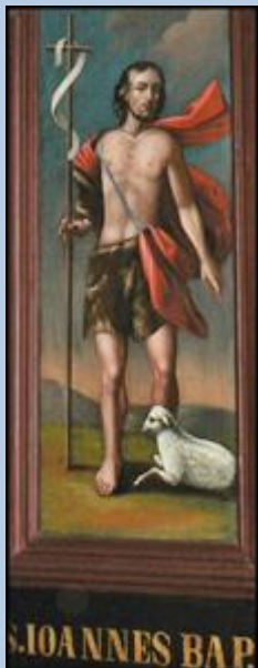
S. IOANNES BAP.