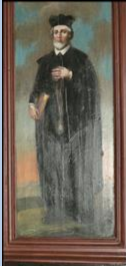
S. PHILIPP. NER