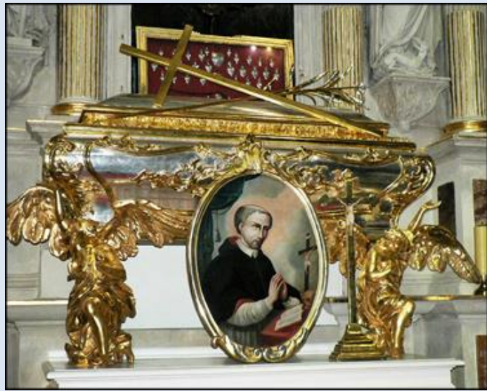
1. Kraków, rel. grob. w baz. Bożego Ciała; 2. Kraków, ob.. w baz. Bożego Ciała;