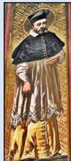
S27,4- Gietrzwałd, ob. w baz. Narodzenia NMP; S27,5- Gietrzwałd, ob.2 w baz. Narodzenia NMP; S27,6- Kraków, ob. w ko św. Katarzyny;