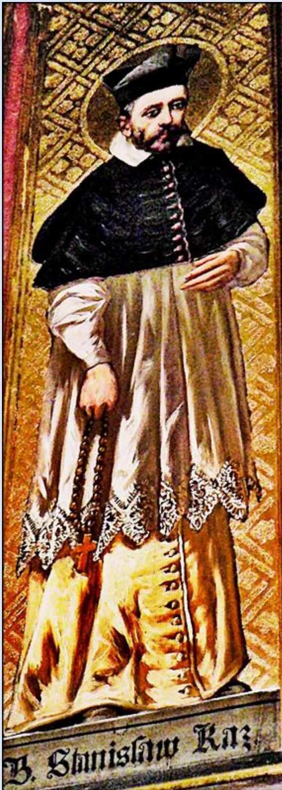
Kraków, ob. w ko św. Katarzyny Al.

zobacz: Święci w Polsce i ich kult w świetle historii http://sancti-in-polonia.wietrzykowski.net/2j.html http://sancti-in-polonia.wietrzykowski.net/7j.html