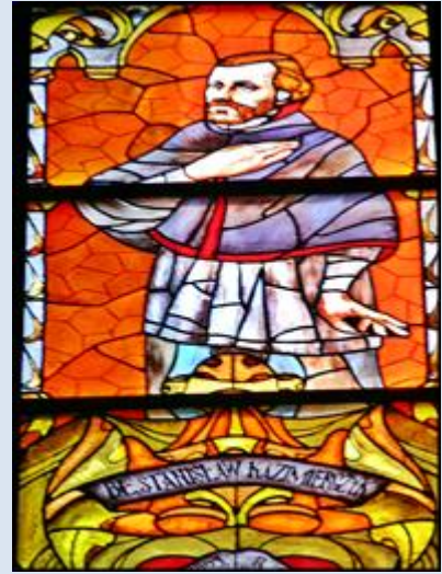
S27,7-Przerąb, ŁDZ, ob. w ko św. Rozalii; S27,8- Przerąb, rel. w ko św. Rozalii; S27,9- Warszawa, wt. w ko śś. Ap. Piotra i Pawła;