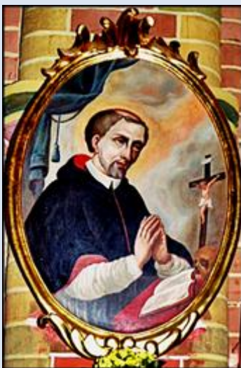
3. Kraków, rel. z litanią. w baz. Bożego Ciała;