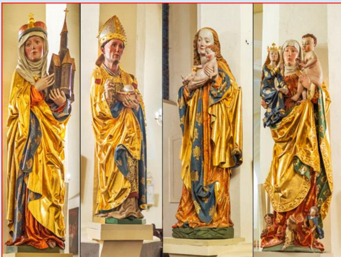
św. Jadwiga Śląska - św. Augustyn - Matka Boża z Dzieciątkiem - św. Anna Samotrzecia