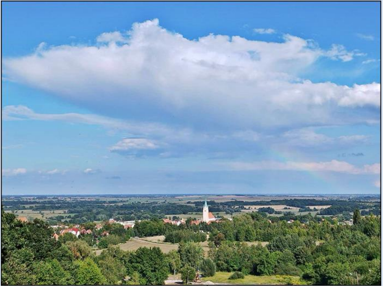
widok z pobliskiej Góry Ślęży (Sobótki)