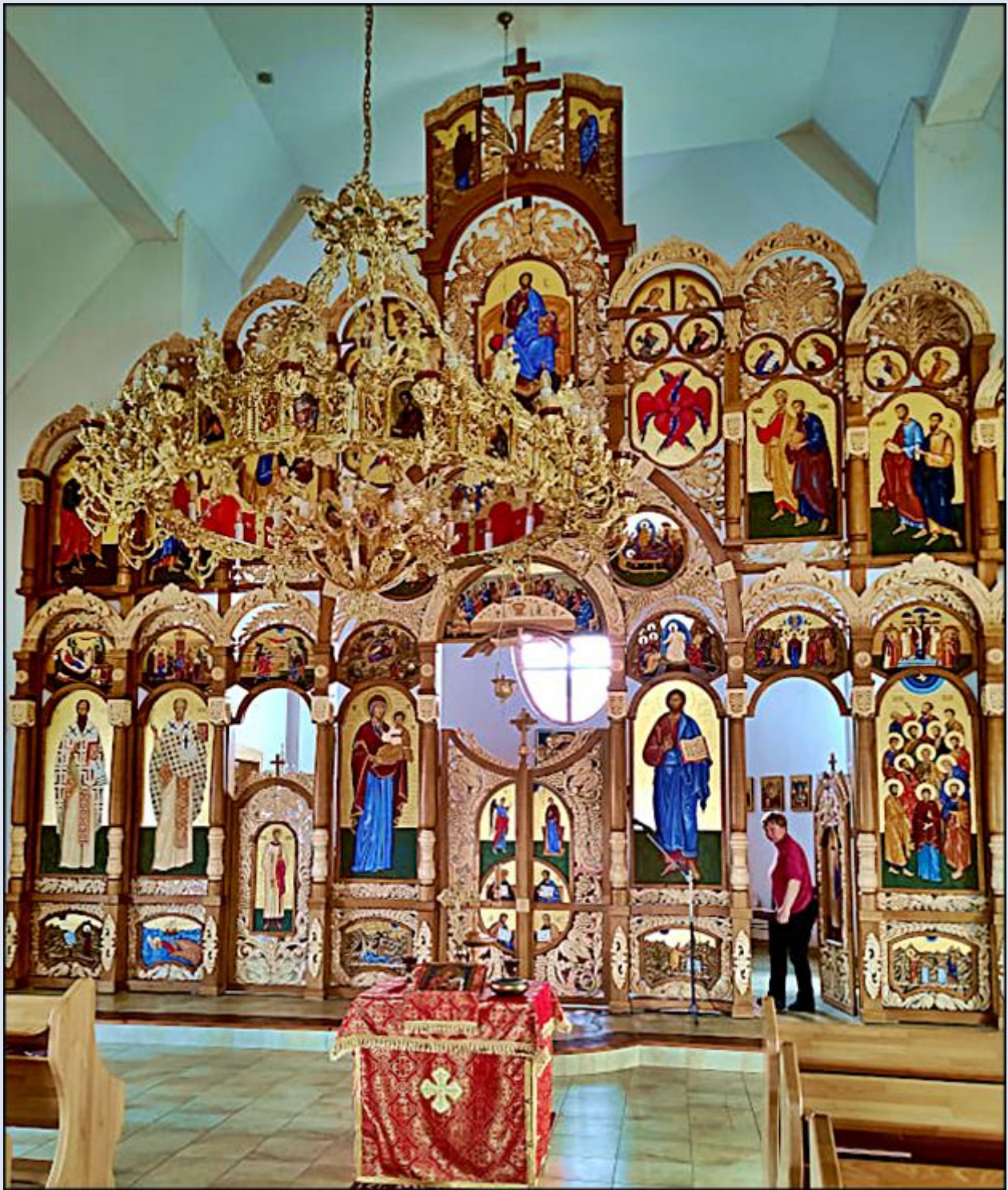
Ikonostas w nowym klasztorze