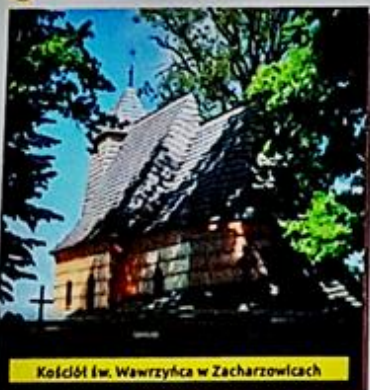
Kościół św. Wawrzyńca w Zacharzowicach