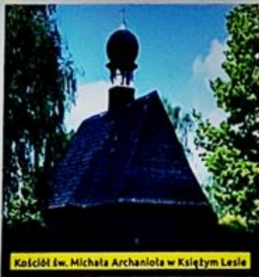
Kościół św. Michała Archanioła w Księcym Lesie