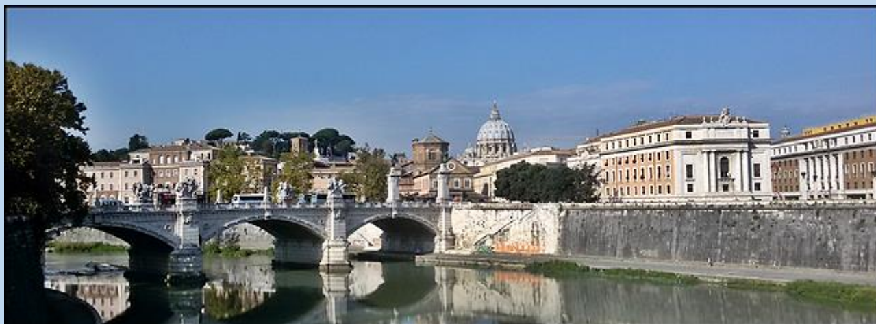
Widok z Mostu Aniołów