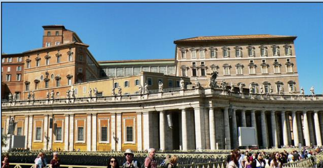
Widok na prawą część Kolumnady Berniniego– z tyłu pałac papieski i Muzeum Watykańskie