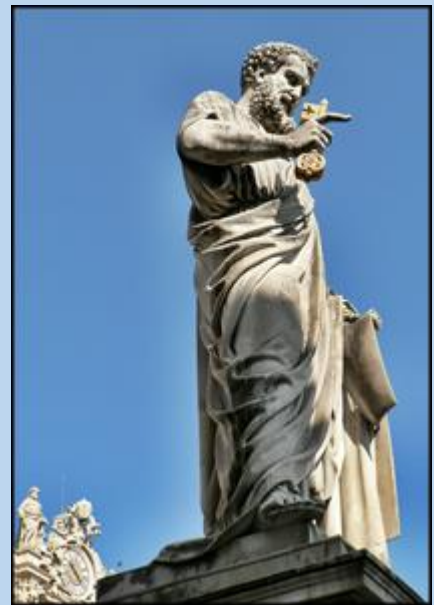
Św. Piotr wita po lewej stronie Placu przed Bazyliką św. Piotra