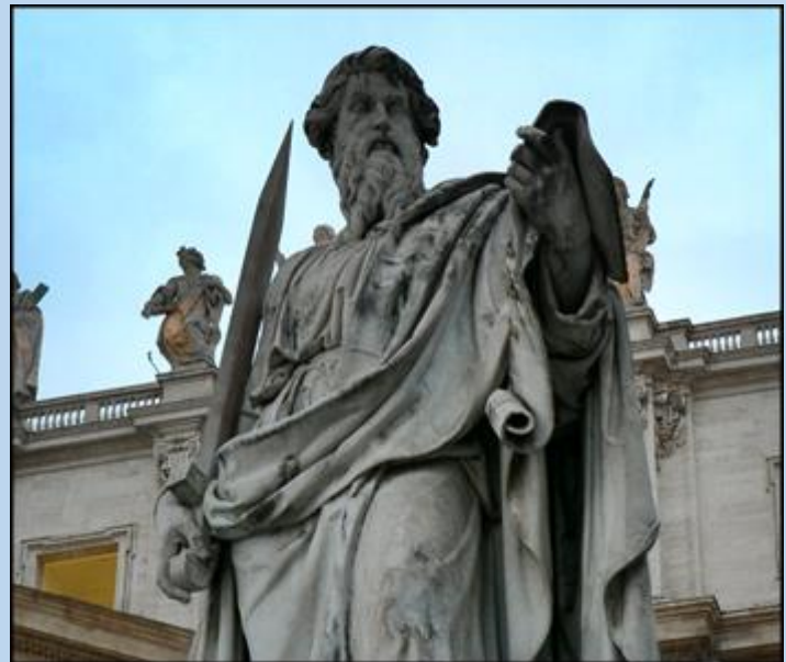
Po prawej stronie Placu wita św. Paweł