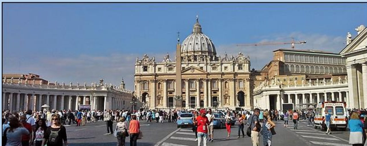
Wejście na Plac św. Piotra z Via Conciliazione