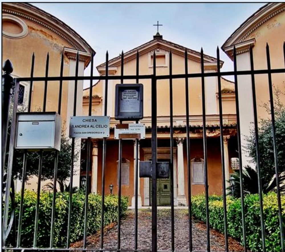
w kompleksie Kościół (Oratorium) św. Andrzeja na Wzgórzu Celio