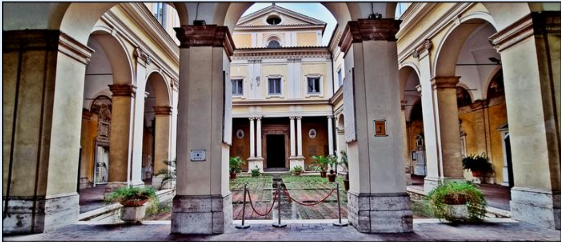
Atrium-dziedziniec z krużgankami i obrazami przed wejściem do kościoła