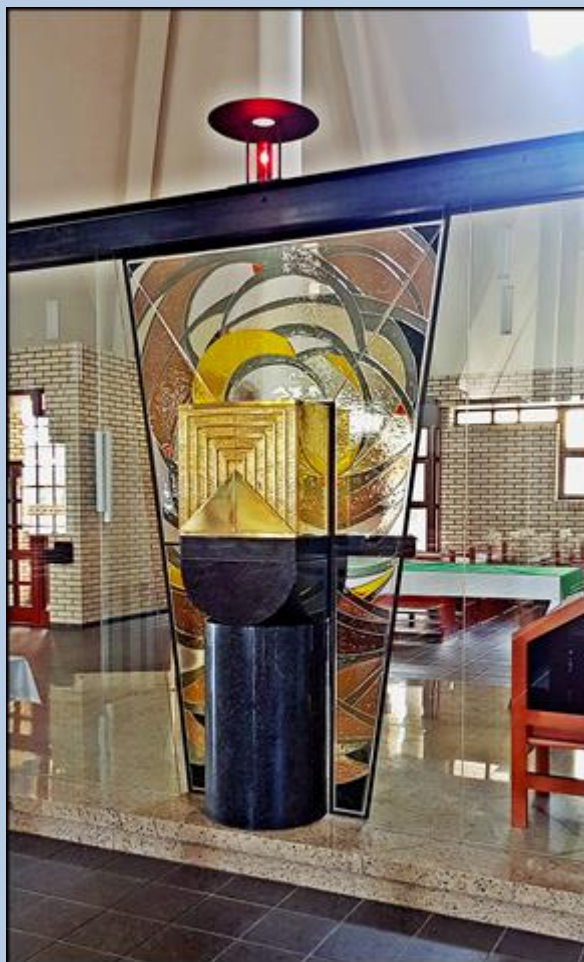
Kaplica za szklaną ścianą i tabernakulum dostępne ze strony kościoła i kaplicy