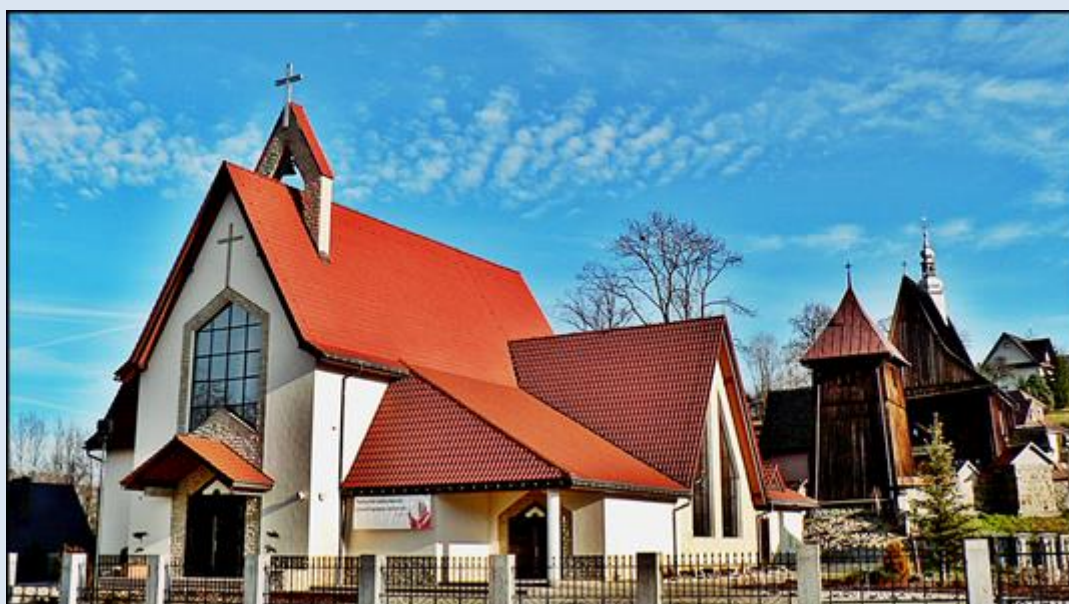
Z przodu nowy Kościół pw. św. Jana Pawła II, za nim stary Kościół pw. Narodzenia NMP