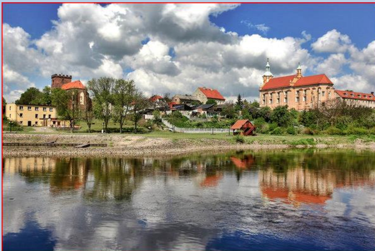
z lewej: Kościół Farny pw. Narodzenia NMP, z prawej: Kościół pw. Ścięcia Głowy św. Jana Chrzciciela