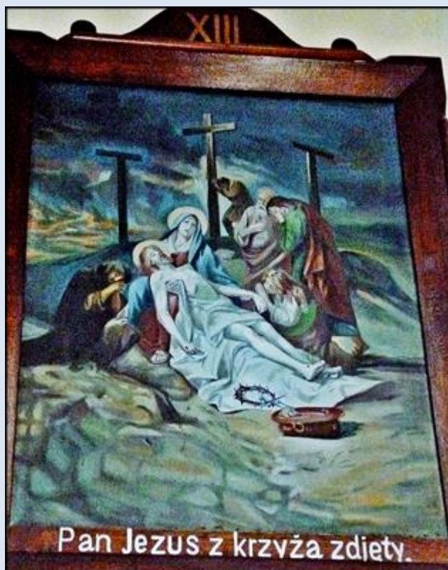
Pan Jezus z krzyża zdiety.