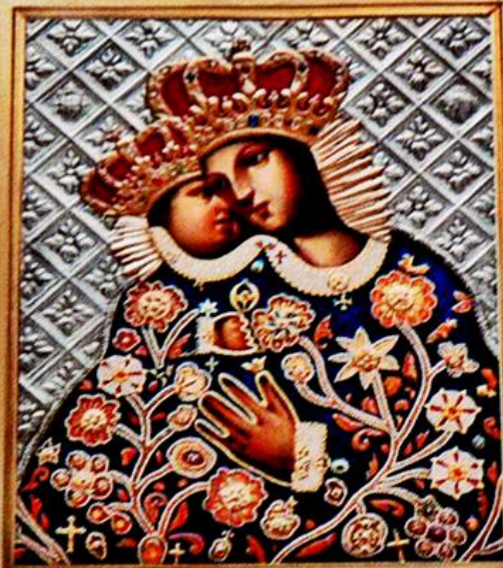
KALWARYJSKA MATKA ZAWIERZENIA

Ojciec Święty często mówił: “Matka Boża Kalwaryjska wychowywała moje serce od najmłodszych lat”. Niech więc, zgodnie z intencją Jana Pawła II, wychowuje i nas wszystkich przez Jej królowanie w naszych sercach i umysłach każdego dnia.