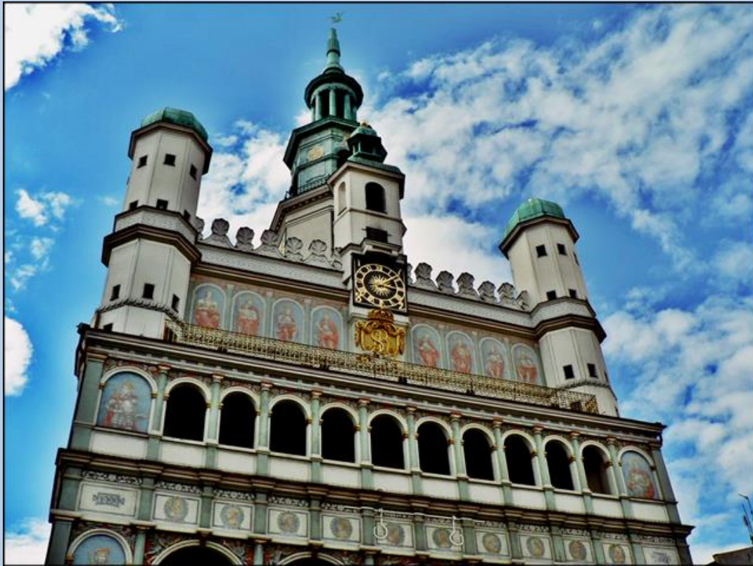
Pobliski Ratusz Poznański