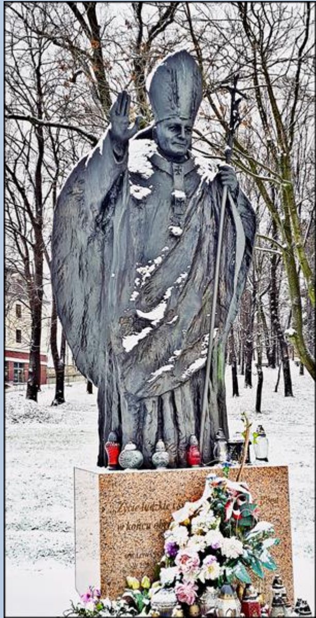
i niedaleki Jan Paweł II w zimowej otoczce