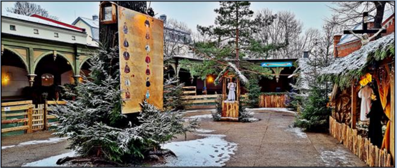
i szopka w krężgankach pielgrzymiego placu w otoczeniu ruchomych figur świecanych i świętych w naturalnej wielkości oraz żywych zwierząt. Tablica z osobami na tablicy w środku placu.