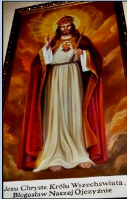
Jeżu Chryste, Królu Wszechświata, Błogosław Naszej Ojczyźnie