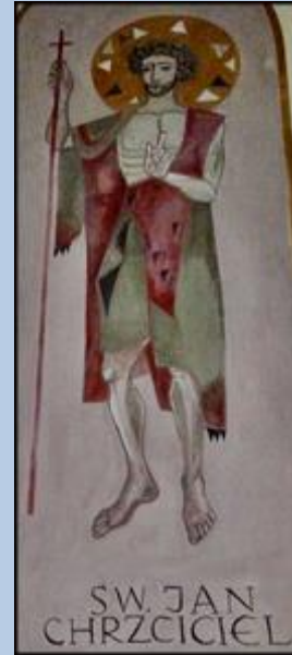
SW. JAN CHRZCICIEL